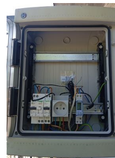
Coffret de commande de l'ombrière avec vol de matériel.