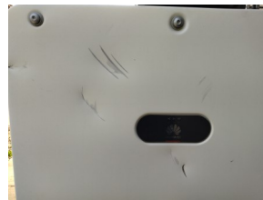
Onduleur de l'ombrière