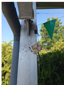
Destruction du détecteur de présence de l'ombrière