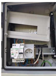
Coffret de commande de l'ombrière avec vol de matériel.