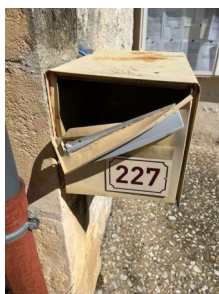
Boite à lettres de la mairie